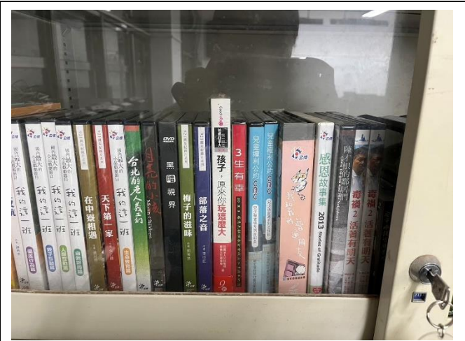
放置相關輔導影片及輔導書籍(第1層)