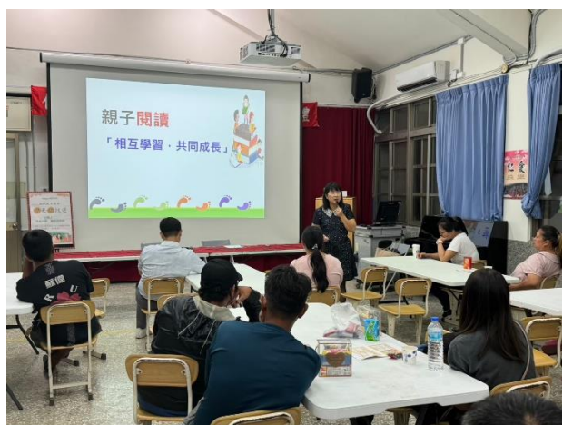
親子閱讀是相互學習，共同成長。