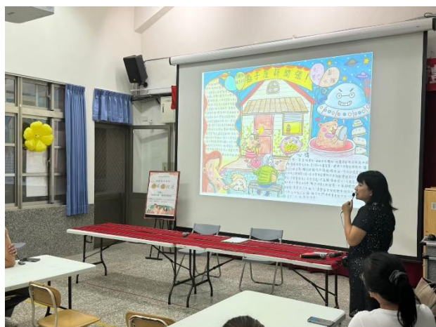
透過閱讀，孩子的書寫不只有諸多詞彙可運用，也會有創造力及想像力。