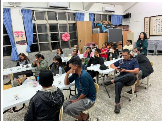
參與的老師和家長都能夠專心聆聽。