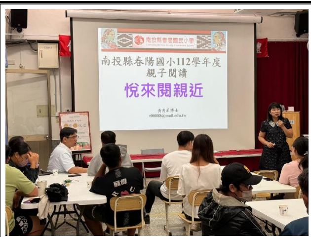
黃博士宣導如何透過閱讀讓親子關係更緊密。