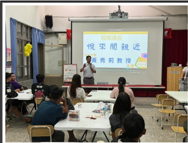
研習前由校長宣導親子閱讀。