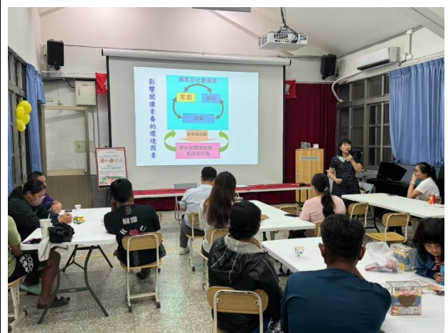
影響閱讀素養的環境因素。